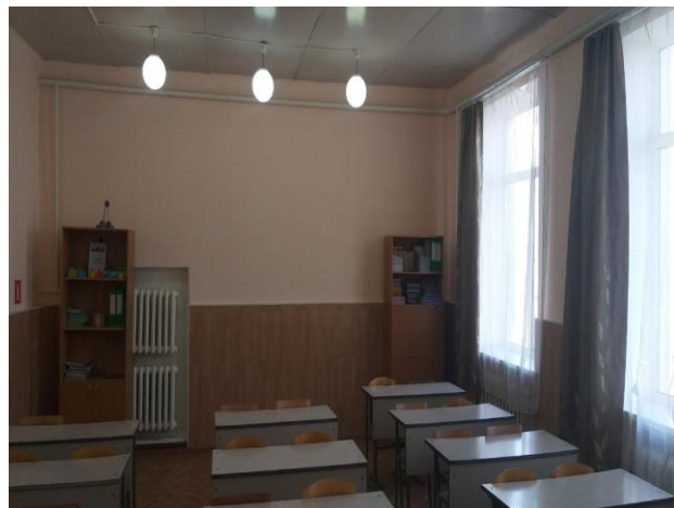
Рис 2 «Визуализация будущего проекта»